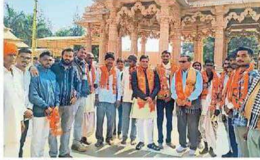
बैठक में सम्मिलित कार्यकर्ता का स्वागत करते अतिथि।