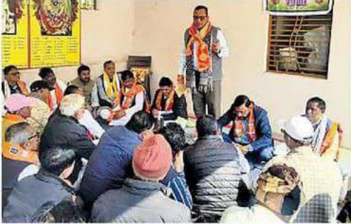
सीमलवाड़ा बैठक को संबोधित करते अतिथि ।